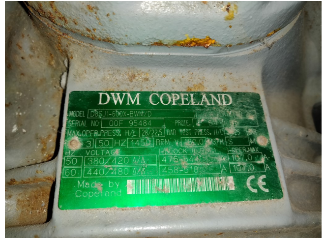
Model: D8SJ-600 X Capacity